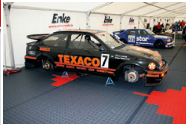
Sicherer Stand auf Enkefloor Bodenplatten.