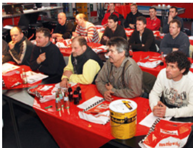
Findet regelmäßig großen Anklang: das Enke Schulungsprogramm.

Wichtig: Bitte melden Sie sich möglichst frühzeitig zu den Schulungsterminen an, denn die Anzahl der Teilnehmer ist begrenzt. Wer zuerst kommt, lernt also zuerst: Mehr Informationen zum Schulungsprogramm und zur Anmeldung erhalten Sie unter 0211 / 30 40 74 oder unter schulungen@enke-werk.de