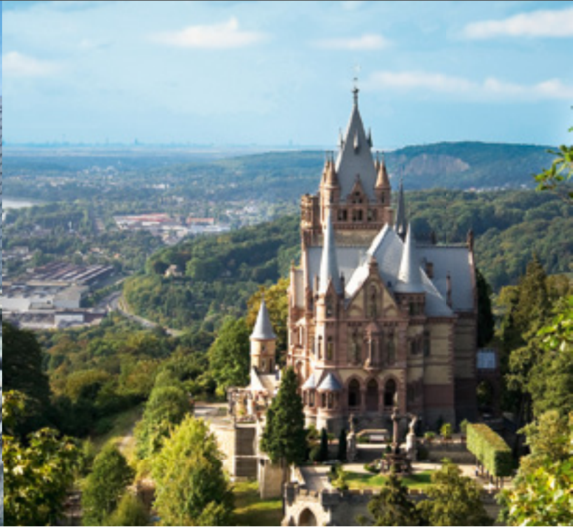
Garantiert wasserdicht: die Drachenvorburg mit frisch abgedichteter Glaskuppel.