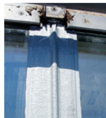
Langzeitsicher abgedichtet mit Enkopur.