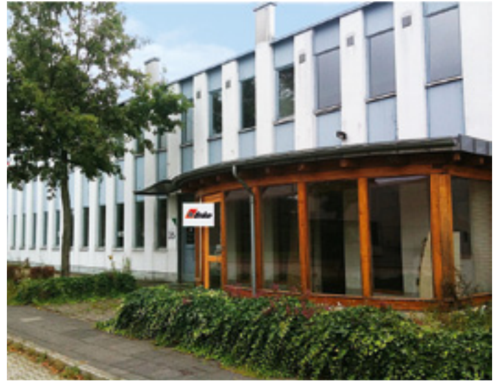
Beste Aussichten: Hier in Langenfeld ist bald jeden Tag „Enke Messe“.

Neben dem Fahrzeugzelt wurde auch ein VIP Zelt mit unseren Platten ausgestattet. Insgesamt wurden ca. 800 m 2 Fläche in nur vier Stunden gelegt – und nach Ende der Veranstaltung ruck, zuck wieder demontiert. 540 m 2 dieses Bodens lagen zeitlich auch schon wieder auf der Essen Motor Show 2010 im Fahrerlager der Event-Halle 7. Dass Enkefloor auch einen mehrmaligen Auf- und Abbau problemlos übersteht, spricht für das hohe Qualitätslevel dieses Produkts.