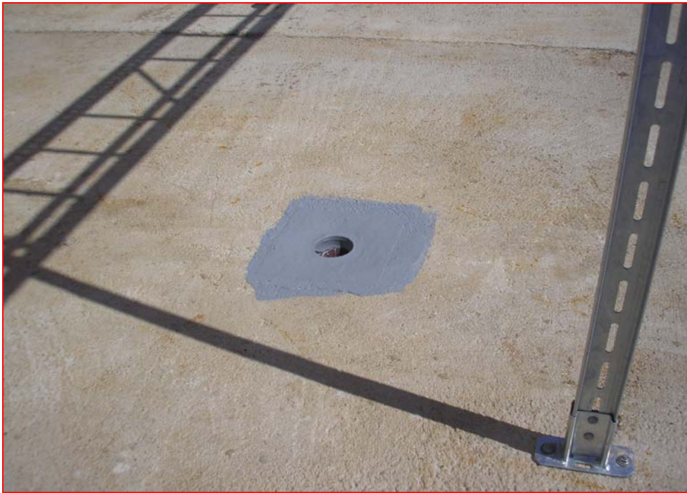
3. Abläufe gesondert einfassen