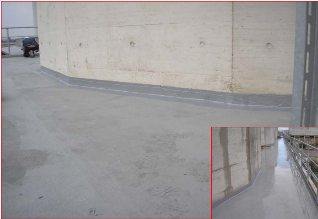
5. Abdichten der Fläche