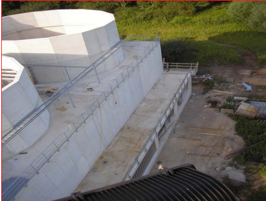
1. Reinigen und Absaugen der gesamten Fläche