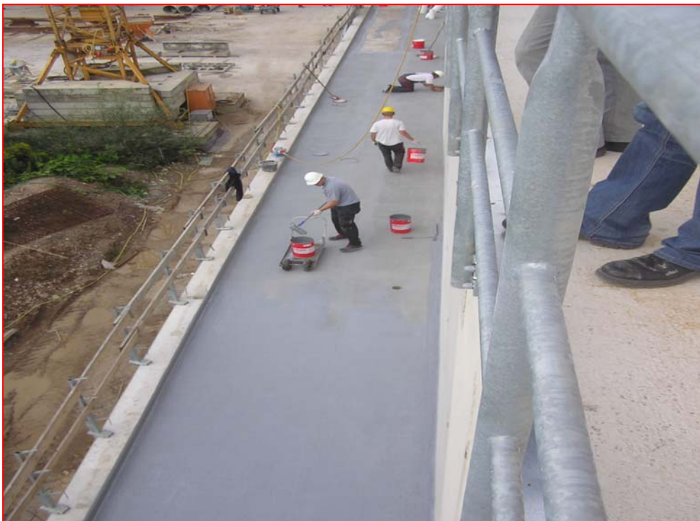
4. Abdichten der Fläche