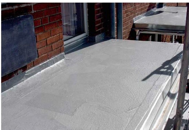
Kritischen, diffizilen Anschlussbereichen