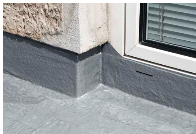
Türausschnitten mit wenig Höhe, Innen- und Außenecken